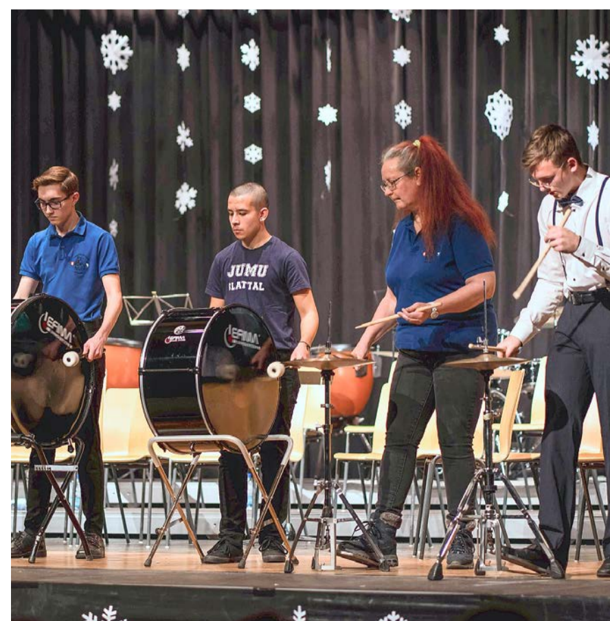
Verschiedene Schlaginstrumente im rhythmischen Zusammenspiel.